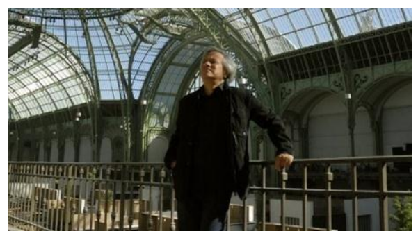
Anish Kapoor au Grand Palais

Rencontre avec des professionnels du marché de l'art. Nous vous proposons de rencontrer lors de séances-discussions des professionnels de haut niveau qui vous feront découvrir la complexité de leurs métiers. Rencontre le mercredi 25 mai à 18h avec Camille Paulhan, jeune critique d'art , qui vous parlera d'une exposition majeure de ce printemps 2011, à savoir Monumenta, qui verra Anish Kapoor investir la nef du Grand Palais.